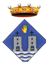
Ajuntament de Torredembarra