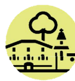
Ajuntament de El Morell